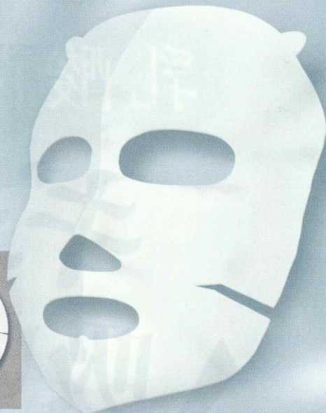
ラポーテチホ 3D形状マスク