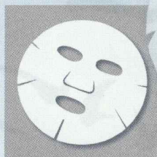
平面状のシートマスク

ラポーテ チホのシートマスクは顔のカーブに合わせた 3Dデザインで、圧倒的な密着力を発揮します。